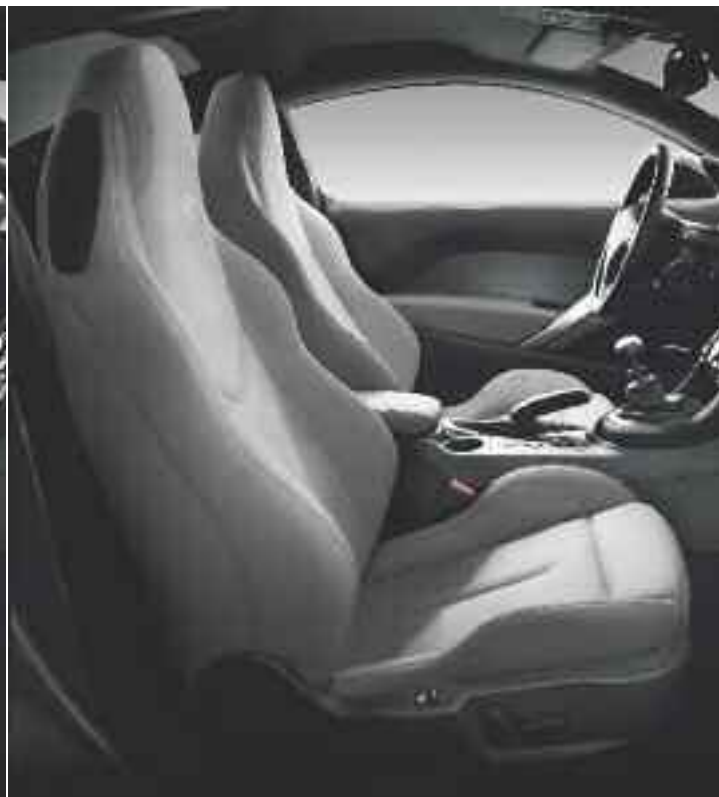
Cuero Integral Lama