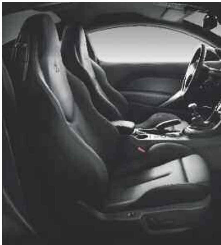
Cuero Integral Mistral