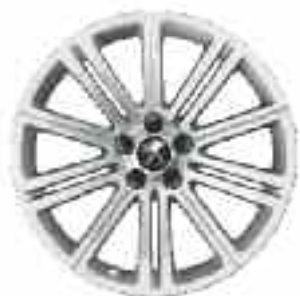
Llantas Original 18"

El carácter dinámico y elegante de su RCZ queda acentuado con las llantas Original de 18".