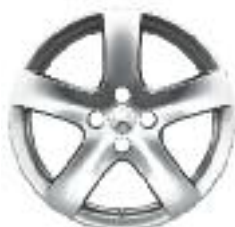
Rinjani 17" Feline