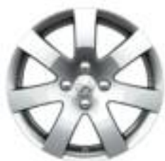
Santiaguito 16" Allure y Allure +